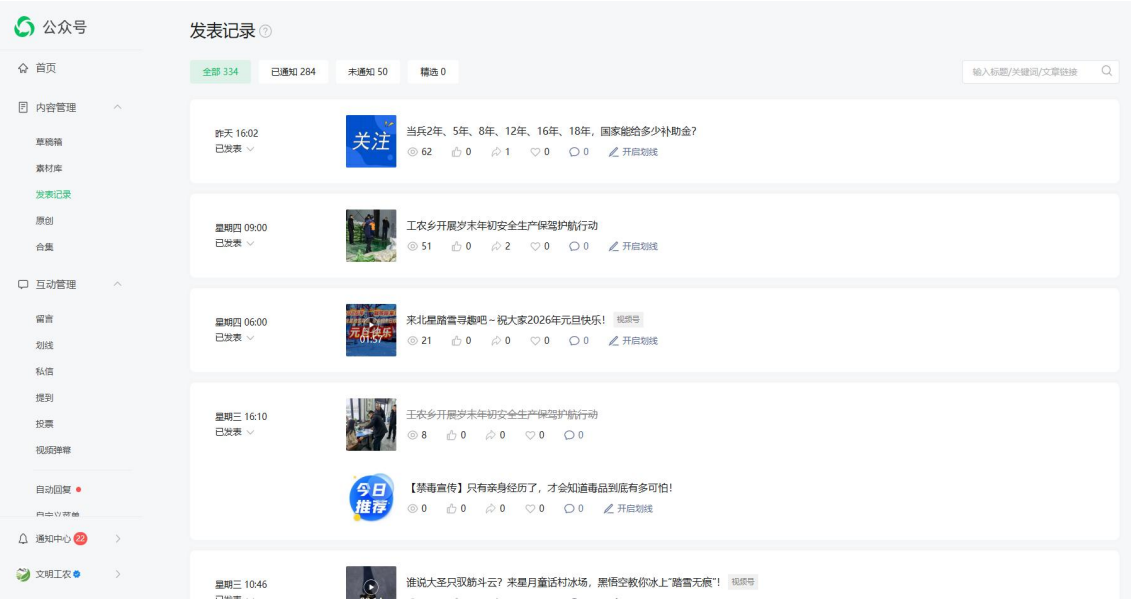
政府微信公开政府信息 242 条